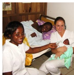
A la maternité

Cet hôpital au centre de la capitale possède un service de médecine interne, chirurgicale et gynécologique. De nombreux patients en situation d'urgence viennent ici pour se faire soigner. La maternité avec le service mère-enfant permet d'aider de nombreuses femmes avec leur enfant.